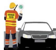
Rys. 1. Kierujący ruchem