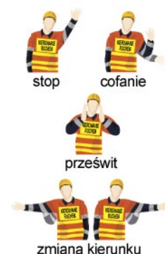
Rys. 4. Znaki ręczne przy kierowaniu ruchem