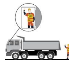
Rys. 3. Kierowanie ruchem